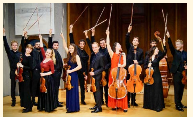
Chamber Ensemble SOUNDEUM.